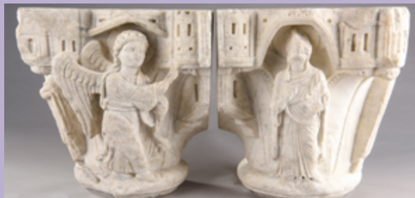
Chapiteau du couvent des cordeliers