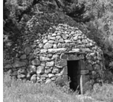
Laissez-vous conter Chamalière