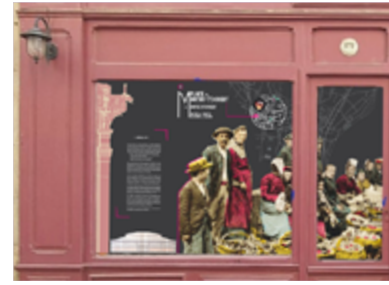
Exposition Place au marché (simulation), Puy-en-Velay © Service Patrimoine

Par les dentellières de l'Atelier Conservatoire National de la Dentelle du Puy-en-Velay RDV musée Crozatier