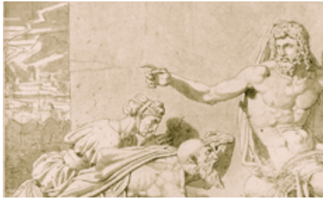
Philémon & Baucis recevant Jupiter J.A.D. Ingres (vers 1800)