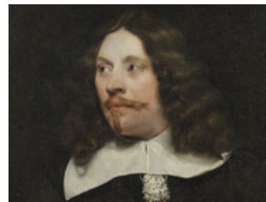
Portrait d'homme, J. A. Rootius (17 e s.) © Service Patrimoine

Domingo © P. Gonnord (2016) FRAC Auvergne