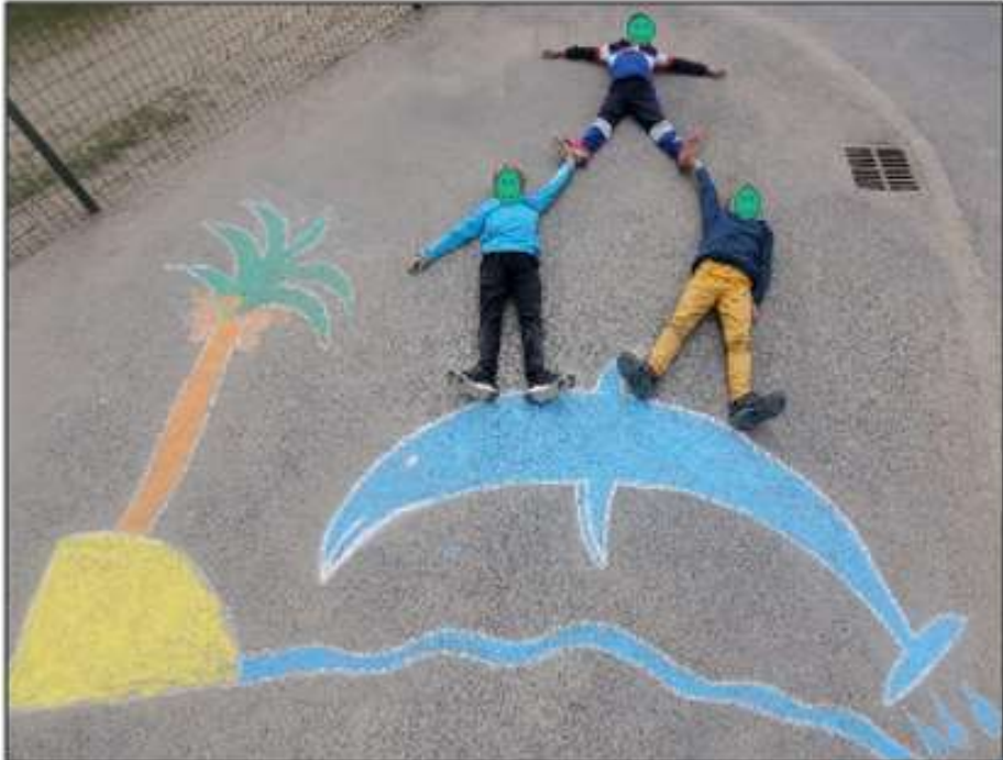
CE1-CE2 Saint Pierre Eynac